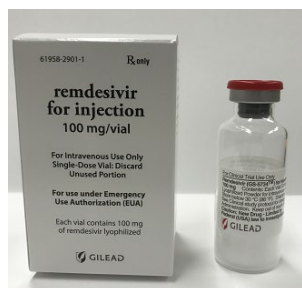
<正面写真 バイアル>